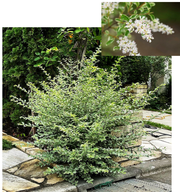
シルバープリペット