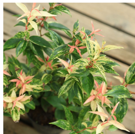
セイヨウイワナンテン