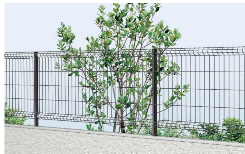
メッシュフェンス: YKKAP イーネットフェンス3F型H800(ブラック)