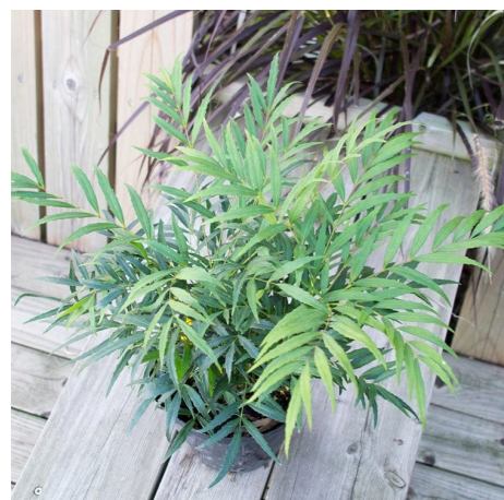
マホニアコンフューサ